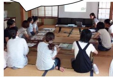
下呂市萩原町での学習会