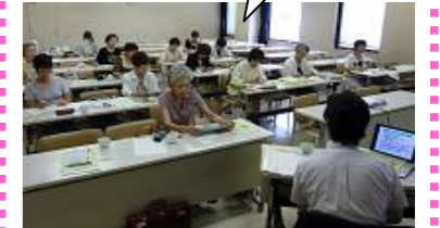
土岐市文化プラザでの学習会