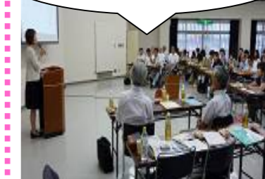
美濃市中央公民館での学習会