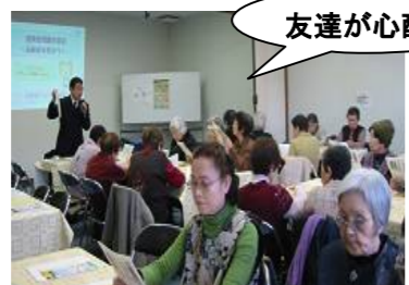
コープぎふ虹の家での学習会