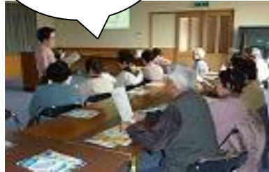
関市千疋公民館での学習会